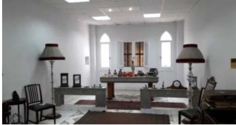
شكل رقم (٢) مبنى القنصلية من الداخل ( غرفة حفظ المقتنيات التاريخية / الطابق الأرضي)