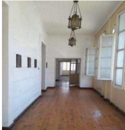
شكل رقم (٣) مبنى القنصلية من الداخل / الطابق العلوي و يظهر مجموعة من اللوحات معلقة علي الجدران