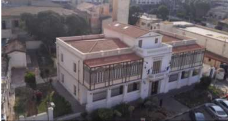
شكل رقم (١) منظر عام لمبنى القنصلية الفرنسية ببورسعيد